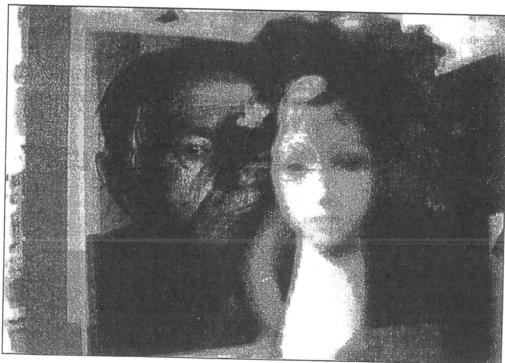
Spisovatel a jeho múza.

Srpen: Film Perličky na dně má premiéru.